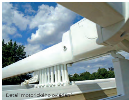
Detail motorického ovládání

Samostatně stojící, ovládání lanovým převodem