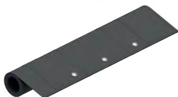
Otvory v potahu pro odtok vody